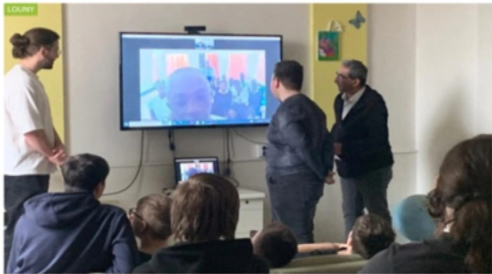
Studenti se ptali na různé otázky.